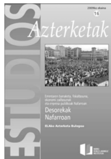
Desorekak Nafarroan. Errentaren banaketa, fiskaltasunak eta enpresa publikoak Nafarroan.

Chambre de commerce et d'industrie, Bayonne