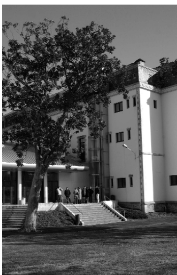
Campus de la Universidad de Baiona

cación...). Al disponer de titulación superior su nivel profesional es mayor que la media. La gran mayoría reconoce querer vivir en su tierra y el vínculo identitario se manifiesta claramente. Sin embargo, si observamos cuantos han optado por estudiar en Hegoalde o cuando preguntamos si trabajar en Hegoalde entra dentro de su perspectiva, vemos que la mayoría prefiere trasladarse a Francia para realizar sus estudios o trabajar. El estudio, por tanto, aporta datos muy positivos con respecto al impacto del proyecto de Seaska en la realidad de Iparralde. Pero también muestra lagunas importantes, como es el hecho de que la mayoría se siente ajeno a Hegoalde o que faltan profesionales en actividades de revitalización socio-económica.