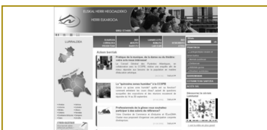
Iparraldeko "Hegoaldeko Herri Elkargoa" www.cc-sudpaysbasque.com