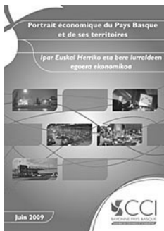
Portrait économique du Pays Basque et de ses territoires.

Chambre de commerce et d'industrie, Bayonne